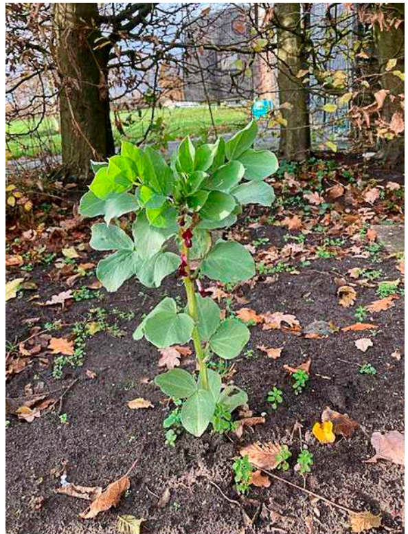
Bij adviseur Bauke Zeinstra bloeide in begin december het in de collectie van het Werkverband voorkomende Robyntsje

Naast meer gezondheid zorgen de boeren zo ook voor meer biodiversiteit. Ze willen de leefomgeving voor bijen en insecten verbeteren. Een biodiverse boomwal vermindert de uitstoot van stikstof en de CO 2 -uitstoot. Bovendien wordt het cultuurlandschap verfraaid door in de gaten in de wallen oorspronkelijke houtige gewassen aan te planten