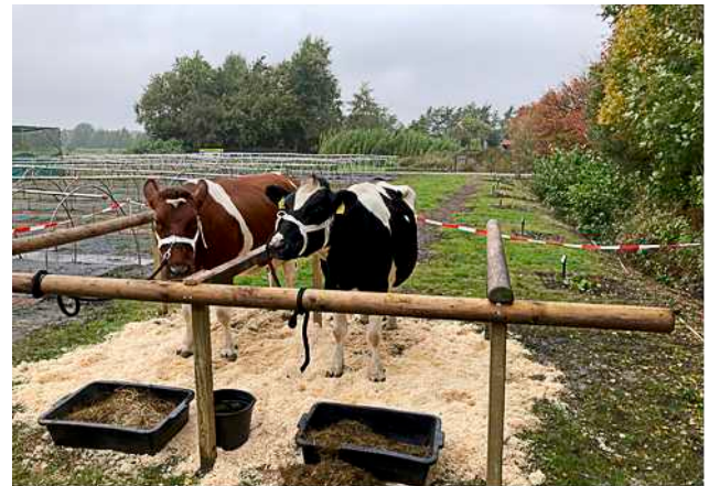
De Fries-Hollande Zwartbonte en de Friese Roodbonte op de Dag van het Fries Levend erfgoed

Afgesproken werd een en ander te bespreken, Het maken van een afspraak is door oudejaarsdrukke in het Provinciehuis tot nu toe uitgebleven.