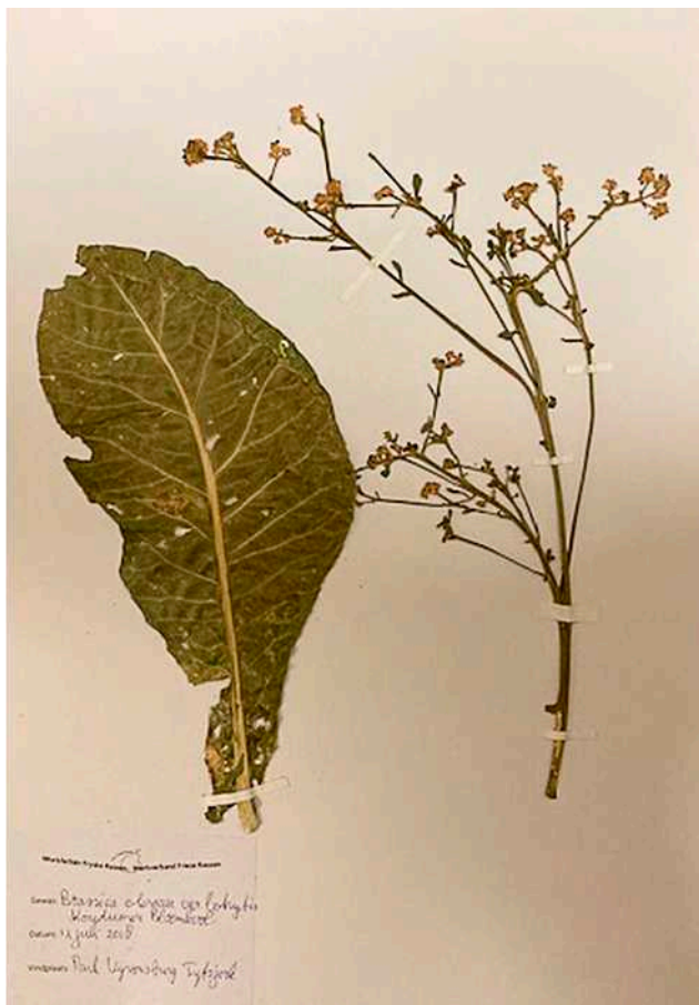
Koudumer Bloemkool als herbariumblad

Vanwege dit jubileum opende beheerder Karst Meijer het eerste weekeinde van november de deuren van zijn Herbarium Frisicum in Wolvega. Hij verzamelde daar een bonte verzameling gedroogde planten. De collectie telt onder meer 6000 gedroogde bramen en 15.000 gedroogde paardenbloemen. Meier ontdekte bij zijn in Fryslân begonnen zoektocht nieuwe soorten. Hij kwam ook tot de ontdekking dat veel soorten in de loop der jaren zijn uitgestorven. Eerder berichtten we in OER dat hij ook een droge en natte collectie van Friese en met Fryslân verwante landbouwgewassen samenstelde en bewaarde.