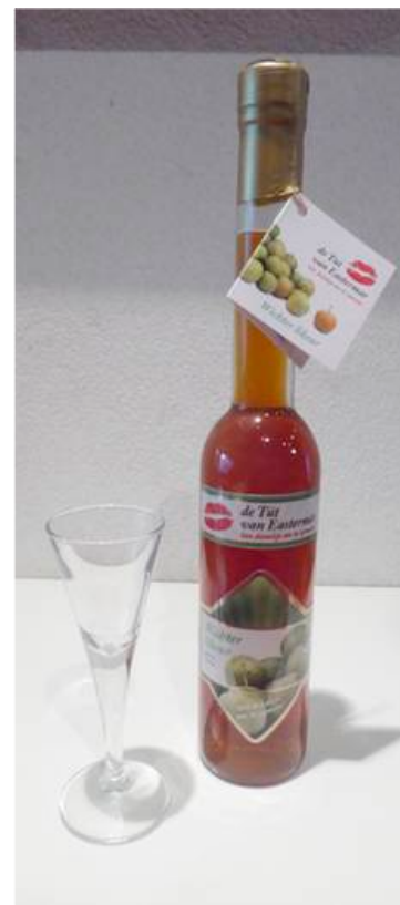
De tút fan Eastermar

Adrie. Jam, compôte, ijs en likeur van wichters (de tút fan Eastermar).