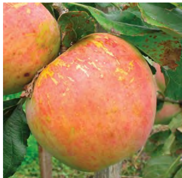
Roem van Drachten