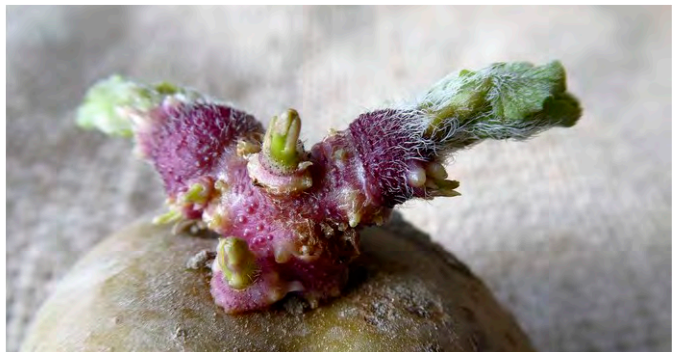
Kiem Vroeg Op